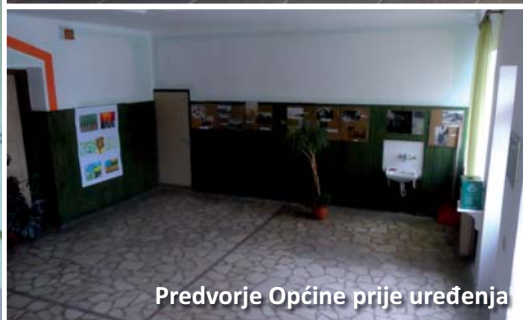
Predvorje Općine prije uređenja