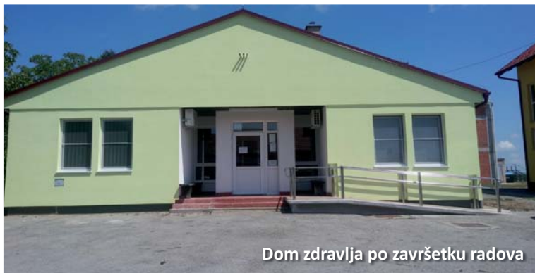
Dom zdravlja po završetku radova