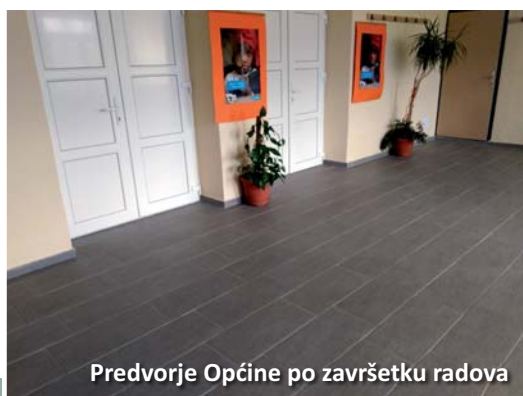
Predvorje Općine po završetku radova