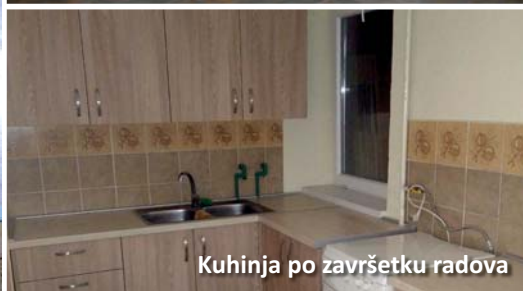
Kuhinja po završetku radova