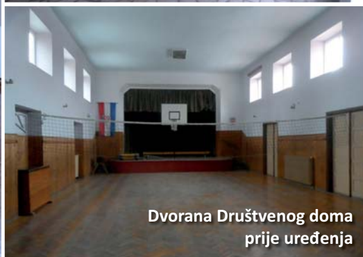
Dvorana Društvenog doma prije uređenja