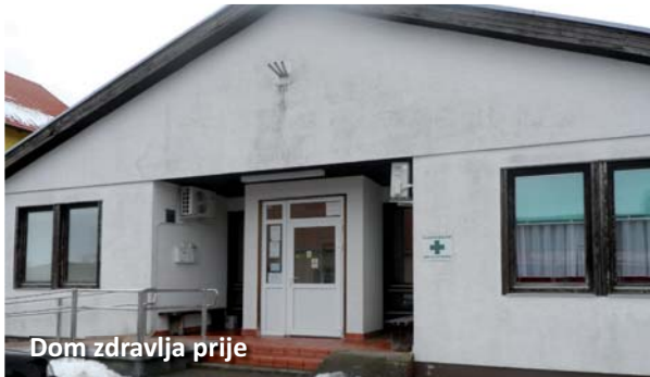
Dom zdravlja prije

Općina Velika Pisanica zahvaljujući sufinanciranju projekta od strane Ministarstva regionalnoga razvoja i fondova Europske unije (32%) te vlastitim sredstvima obnovila je zgradu Doma zdravlja na način da je zamijenjena vanjska toplinska izolacija, sanirano krovništvo i zamijenjena dotrajala drvena stolarija. Također su izvršeni i radovi na unutar-njem uređenju. Na taj način poboljšala se kvaliteta života lokalnog stanovništva kroz podizanje standarda u primar-njoj zdravstvenoj zaštiti.