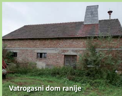
Vatrogasni dom ranije