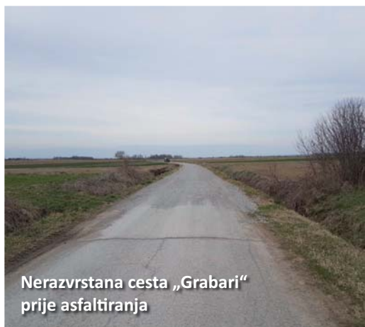
Nerazvrstana cesta „Grabari“ prije asfaltiranja

na javne pozive, projekt je sufinanciran od strane Ministarstva regionalnoga razvoja i fondova Europske unije, Ministarstva graditeljstva i prostornoga uređenja, kao i iz vlastitih sredstava. Vrijednost izvršene investicije je 1.062.668,75 kn, a radove je izvodilo poduzeće Ceste d.d. Bjelovar.