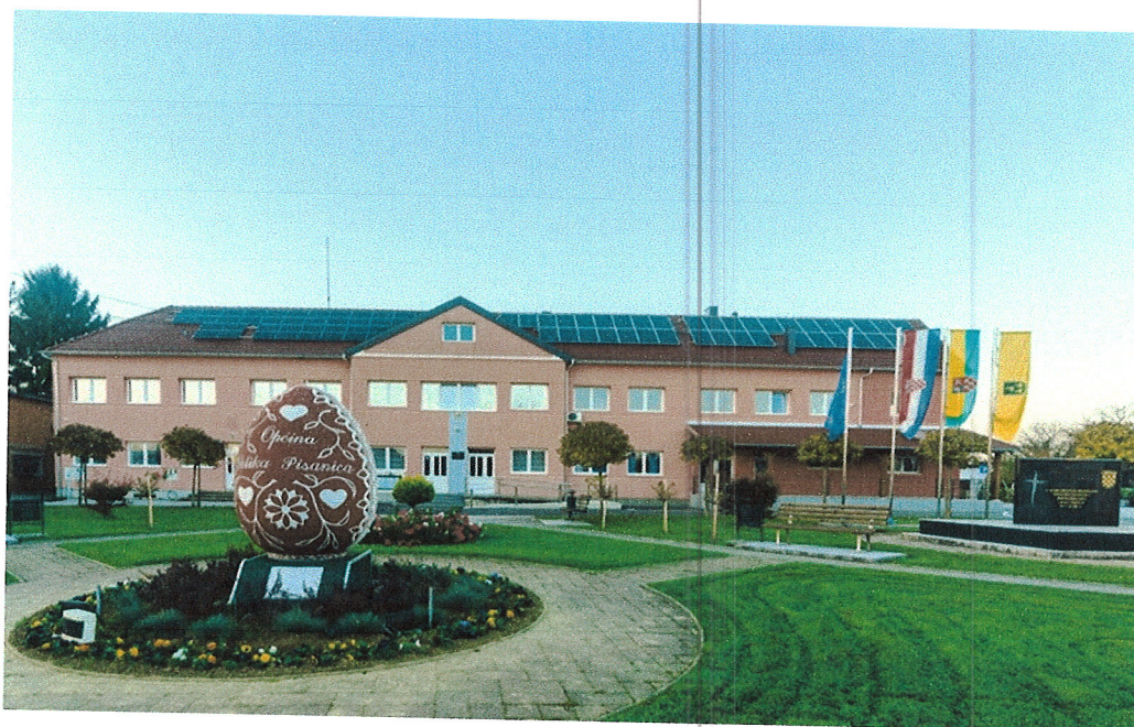
Slika 2: Zgrada Općine Velika Pisanica