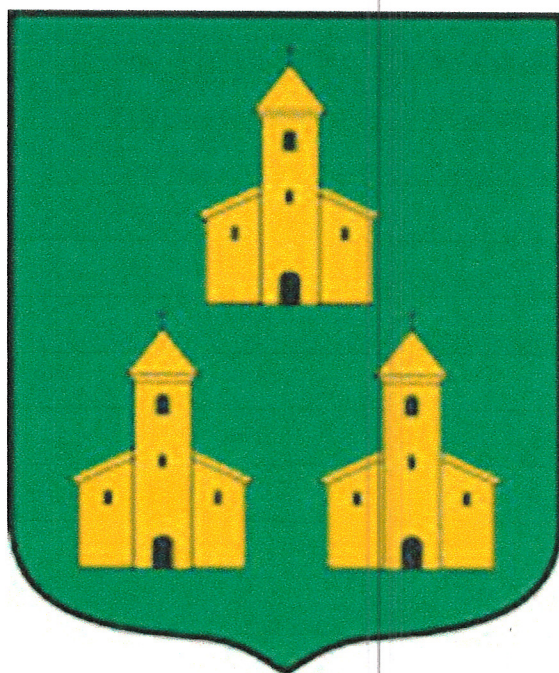
Slika 1: Grb Općine Velika Pisanica